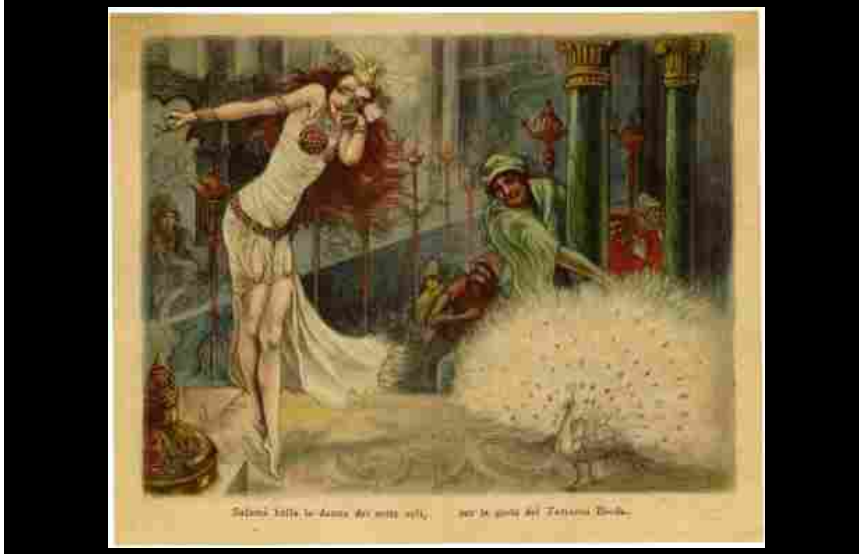
Salomé, 1924. Pubblicità profumeria Tosi, Milano; calendarietto al profumo 'Ora Mistica'

18.00 a ciclo continuo, sarà infatti possibile prendere parte a Questione di naso. Indovina l'odore , un percorso olfattivo a ingresso libero, per grandi e bambini, che permetterà di "testare" l'attitudine individuale nel riconoscere gli odori.